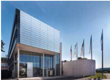
AESCULAP AKADEMIE GMBH Am Aesculap-Platz 78532 Tuttlingen