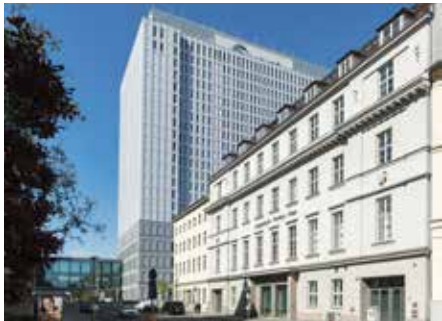
AESCULAP AKADEMIE GMBH im Langenbeck-Virchow-Haus Luisenstraße 58–59 10117 Berlin